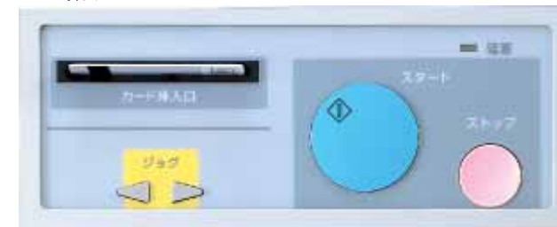
ジョグスイッチ ストップスイッチ

<操作パネルは誤作動を防ぐボタンスイッチを採用> ※操作パネルはV-888のもので、キーカード挿入口 スタートスイッチ