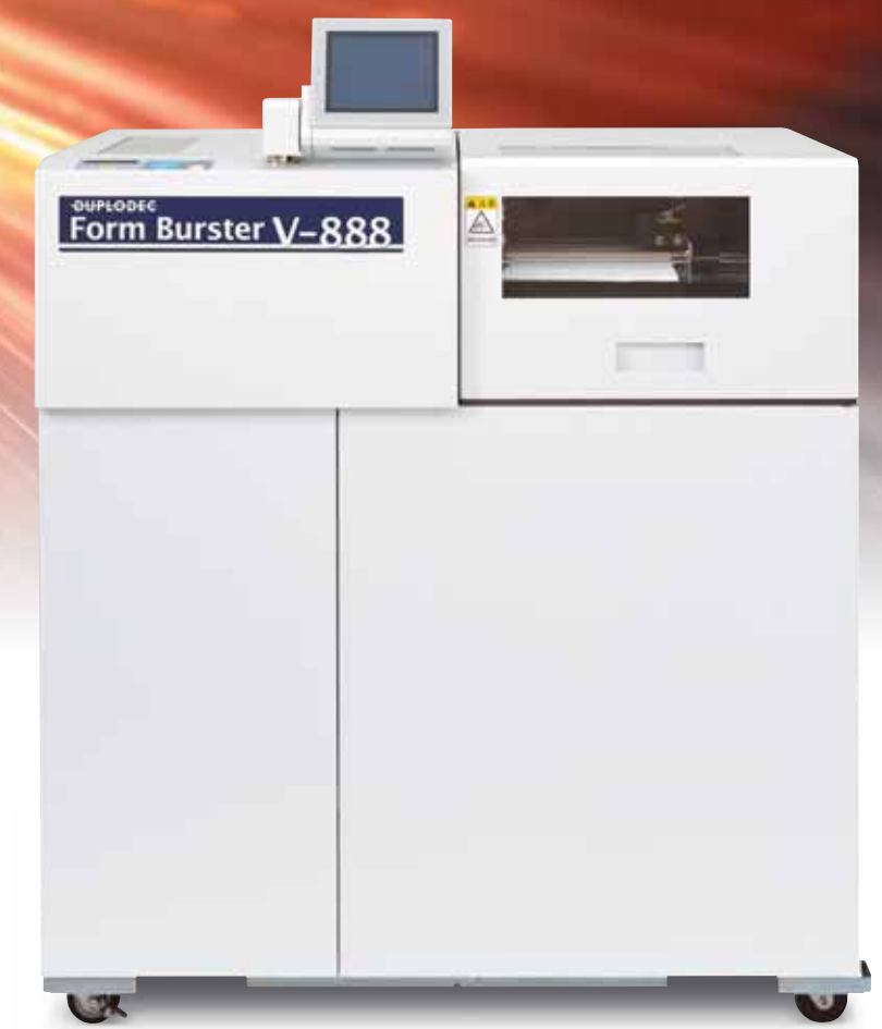
連続フォームバスターV-888