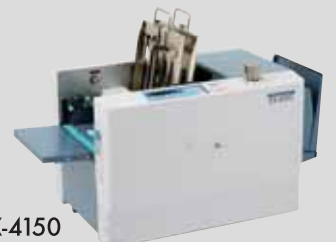
EXPRESS SEALER EX-4100/EX-4150

大容量給排紙と高速処理で作業時間を短縮。また、小口処理に使いやすい手差し挿入口を設け、さまざまな作業シーンに柔軟に対応します。